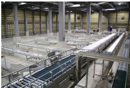
ケース仕分ソータ