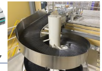
スパイラルコンベヤ

複数のロボットがステーションにいる作業者のもとへ該当の商品を棚ごと運ぶため、作業負荷軽減や作業効率の向上に寄与